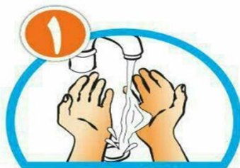
دست ها را خیس کرده و بعد آن ها را صابونی کنید.