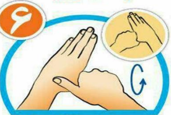
شست ها را جداگانه و دقیق بشویید.