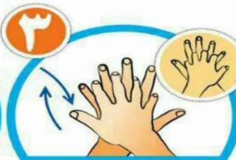
بین انگشتان را در قسمت پشت بشویید.