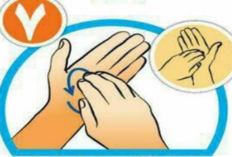
خطوط کف دست را با نوک انگشتان بشویید.