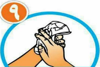
دست ها را با دستمال خشک کنید.