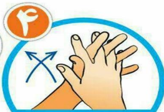
بین انگشتان را از روبرو بشویید.