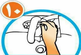
با همان دستمال شبر آب را ببندید و دستمال را در سطل زباله بیاندازید.