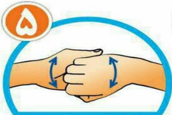
نوک انگشتان را درهم گره کرده و به خوبی بشویید.