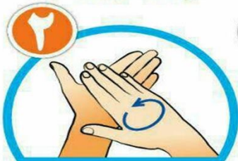
کف دست ها را با هم بشویید.